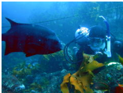
人慣れしているイシダイのクロちゃん