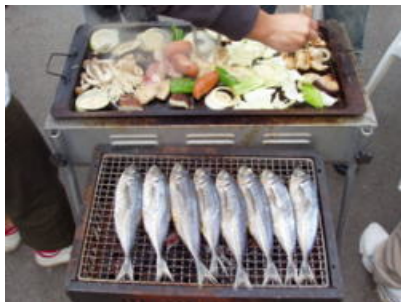
ダイビング後のBBQも楽しみの一つですね♪

今日ではプラットホームはインダイやハナタツなどのたくさんの生物の住み家になっています。