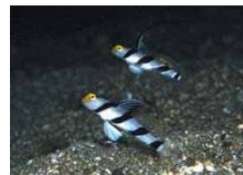
黄金崎のネズリンボウ