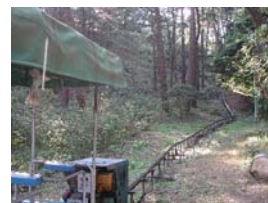
黄金崎ビーチへは、ダイバー専用のトロッコで行く事が出来ます！