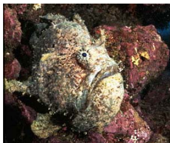
ソウシカエルアンコウ