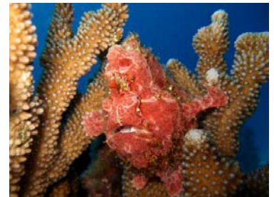
オオモンカエルアンコウ