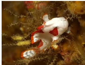
クマドリカエルアンコウ