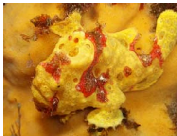
イロカエルアンコウ