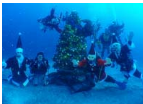
期間限定クリスマスツリー