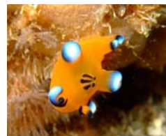
ピカチュウウミウシ

日本で最初に本格的ダイビング施設を備えたポイントです。 もともと東海大学の海洋資源研究等の目的で作られた為、生物が豊富で多数の新種も発見されています。 水中は大きな根と白い砂地がはっきり分かれており、地形はダイバーにはたまらないポイントの一つです。 イベントの時期には、水中クリスマスツリーや、バレンタイン限定のハート型造形物などが設置されます。 水中ポストもあり、実際に水中で投函した手紙を送る事が出来ますっ！